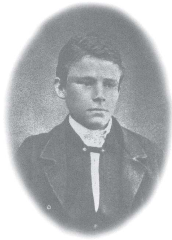
Picha ya kwanza iliyopatikana ya Jordan 1861?